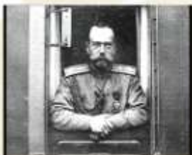
«Кругом измена и трусость, и обман!» Николай II 2 марта 1917 г. Псков